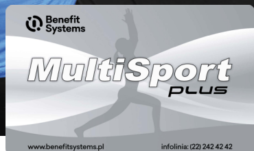
Karta MultiSport Plus

Wybierz kartę idealną dla Ciebie i korzystaj z tysięcy obiektów sportowych w całej Polsce.