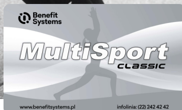
Karta MultiSport Classic

Członek Związku: 138 zł Pracownik VW Poznań: 206 zł